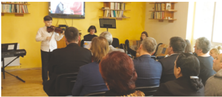
Výročie si v zariadení pripomenuli komorným podujatím.

Zdá sa, ako by to bolo iba včera, keď Nezábudka, n.o. oslávila 10 rokov svojej činnosti. Ani sme sa nenazdali a v tomto roku oslavujeme už 15 rokov odvtedy, ako je budova Nezábudky otvorená pre klientov, zamestnancov, príbuzných, verejnosť a pre všetkých, ktorí potrebujú v tejto oblasti pomocť alebo poradiť.