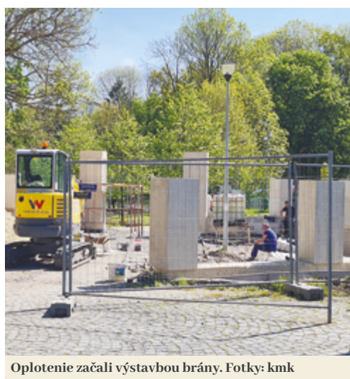
Oplotenie začali výstavbou brány.

Ako ďalej pokračoval, v rámci projektu vybudujú aj oplotenie z plotových dielcov okolo celého osemhektárového parku. „Nová časť oplotenia bude mať dĺžku 1,4 kilometra. Z nich vyše 500 metrov sa bude ťahať paralelne s koľajnicami. To nám spôsobilo značné komplikácie pri povoľovaní. Rátali sme s tým, preto sme projekt rozdelili a začali s bránou. Proces sa napokon pretiahol až na 2,5 roka,“ ozrejmil. Pri koľajach sa podľa jeho slov ťahne ochranné pásmo železníc, v ktorom sa nachádzajú signalizačné zariadenia. „Sú veľmi